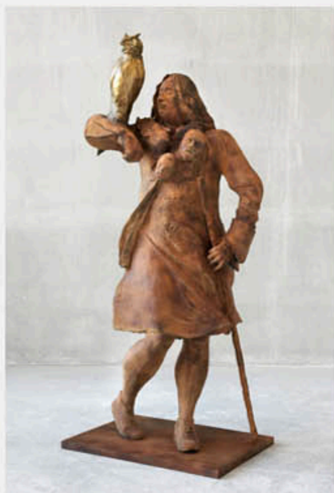
Neo Rauch, Die Jägerin, 2011, Bronze, 227 x 103 x 70 cm, Auflage: 3/3.

Indem er die verschiedenen Phasen bei der Fertigstellung eines Gebäudes ablichtet, macht Mayer Transformationsprozesse sichtbar und lässt den fertigen Bau erahnen, ohne ihn tatsächlich abzubilden.