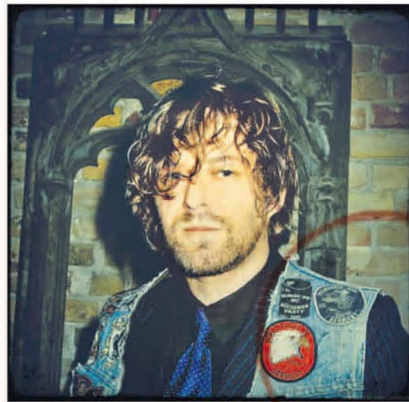
Martin Eder wurde 1968 in Augsburg geboren, wuchs auf im Pfarrdorf Batzenhofen. Er studierte in Augsburg und Dresden und stieg in den Nullerjahren zum weltweit gefragten Künstler auf, für dessen Bilder bis zu einer halben Million Dollar bezahlt werden

Out of Batzenhofen: Der Maler Martin Eder entscheidet sich für süddeutsche Hausmannskost