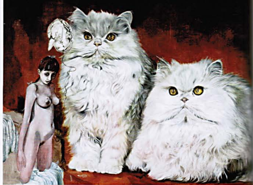
Süße Monsterkätzchen lauern auf Lolita: „The Birdwatchers“ (2006, 180 x 240 cm)

Eders Durchbruch als Künstler war die „Art Cologne“ 2001. Richtig bekannt wurde er 2004 mit Einzelausstellungen im Kunstverein Lingen und bei „Eigen + Art“, wo er die Wände schwarz anmalte, weil er findet, dass seine Bilder auf dunklem Grund am besten wirken. Vielleicht ein Versuch, die dunkle Seite seiner Kunst betonen, die den Kitsch aus Kätzchen, Kindfrauen und Hundewelpen überhaupt erträglich macht. Jedes der Motive für sich genommen ist nämlich ziemlich flach, erst im Zusammenspiel entfalten sie ihre abgründige Wirkung. Softpor-